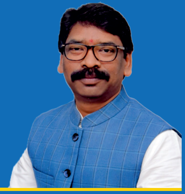
हेमन्त सोरेन मुख्यमंत्री