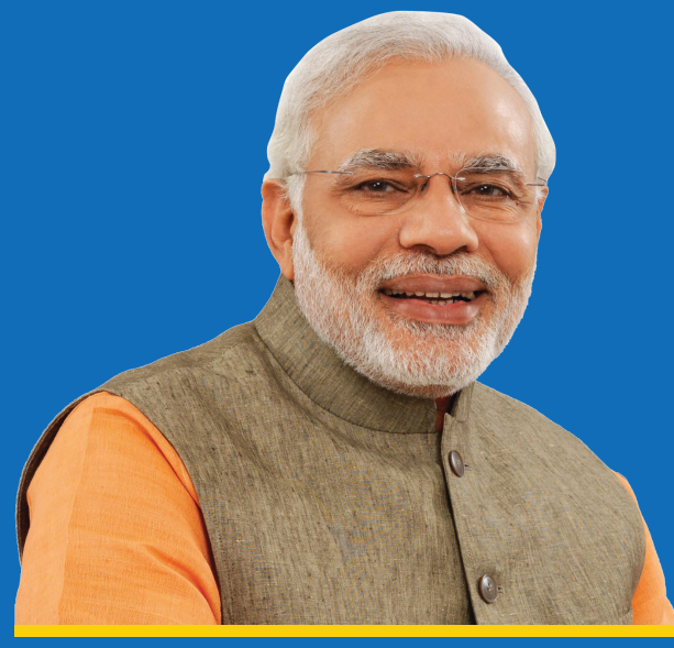
नरेंद्र मोदी प्रधानमंत्री